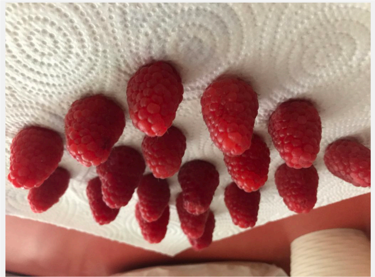
FOCOS App - first test - Stefano Paganini

FOCOS: foto e ritratti con profondità di campo (iOS)