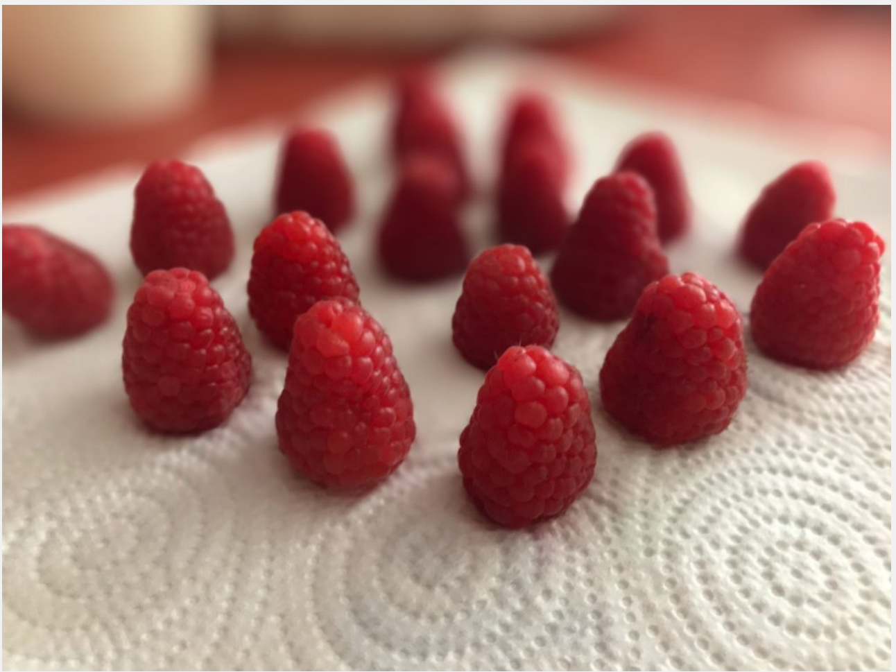
FOCOS App - second test - Stefano Paganini

FOCOS: foto e ritratti con profondità di campo (iOS)